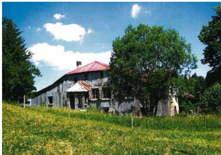
La ferme Les Mollards-des-Aubert» recevra 50'000 frs pour refaire sa façade nord.

Donation Tous les deux ans, l'institution de prévoyance Retraites Populaires mène une action de mécénat servant la cause de la sauvegarde du patrimoine vaudois. La thématique de cette année est liée aux fermes.