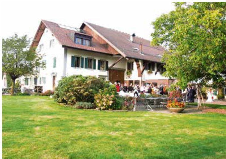
La ferme de la Coulette à Belmont accueillait les 250 invités de Retraites populaires.

Plus de 250 personnes étaient réunies le 26 septembre dernier à Belmont-sur-Lausanne pour découvrir à quel joyau en péril une aide allait être attribuée. Fondé par Retraites Populaires dans le cadre de son 100e anniversaire, le Prix du patrimoine vaudois aide financièrement la réalisation d'un projet en cours. Décerné tous les deux ans avec une somme de 50'000 francs, il vivait sa 4e édition après trois premiers thèmes: «Le chasselas» avec un soutien à la création du Conservatoire mondial du Chasselas à Rivaz; «Châteaux en Pays de Vaud» qui a permis l'ouverture du donjon du Château d'Oron et «Forêts vaudoises» qui a vu la création d'une passerelle au-dessus de l'Eau froide permettant de compléter les 7 km du sentier de la Joux Verte.