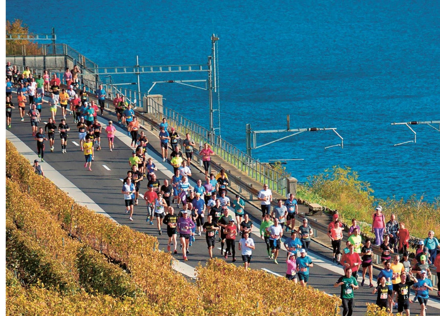
La presse spécialisée a classé le Lausanne Marathon parmi les vingt plus beaux marathons du monde.

Du côté de Lausanne, la ville se devait de tenir son rang de capitale olympique et compte pas moins de deux grandes courses d'envergure internationale avec les 20 km de Lausanne au printemps et le Lausanne Marathon en automne. Deux événements majeurs pour le sport vaudois, qui attirent près de 23'000 participants pour le premier et près de 15'000 pour le second. Et qui constituent une