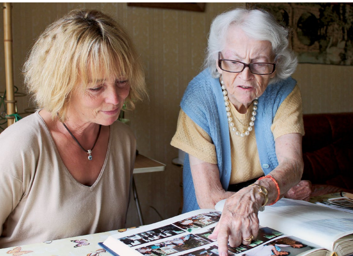
Les équipiers de Pro-xy, qui relèvent les proches aidants dans leurs tâches, offrent aux personnes aidées une bouffée d'air frais qui égaye leur quotidien.

On les appelle les proches aidants. Leur rôle, qui est de s'occuper d'un membre de leur famille, d'un ami voire d'un voisin nécessitant assistance, n'est ni bien connu ni reconnu car il se déroule dans l'intimité. Mais grâce au travail de diverses institutions, cela est en passe de changer.