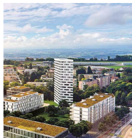
Le projet des « Balcons du Mont » au Mont-sur-Lausanne

Les nouvelles constructions offrent des opportunités de brassage entre immobilier d'habitation et immobilier commercial.