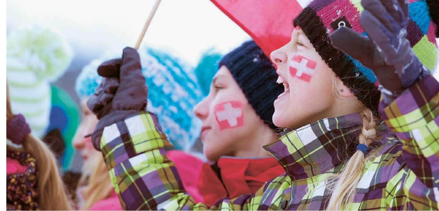
Bella vita _ Le magazine de Retraites Populaires

Le dossier de candidature propose que l'organisation des Jeux soit partagée en trois lieux. Le premier, situé à Lausanne, prévoit d'accueillir le village olympique, les cérémonies d'ouverture, de clôture et de remises de médailles, tous les sports de glace ainsi